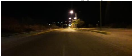
ANTES LAMPARA DE VAPOR DE SODIO

El día 20 de enero del año 2019 comenzamos con los trabajos en la Av. Lázaro Cárdenas hasta el circuito número 2 Mezquitic el cual se encuentra ubicado a 100 mts del auto Hotel Pink Blue, el cual consiste en la colocación de 140 lámparas LED 100 W, las cuales sustituirán las lampas que se encuentran ubicadas en este circuito las cuales son de 250w y un 10% de ellas 100w de adictivo metálico y de adictivo de sodio, todo esto con el fin de reducir la emisión de calor contaminante hacia la atmosfera la cual es emitida por el mismo balastro y el mismo foco, además de poder hacer una reducción en el gasto de la energía para el municipio, ya que el foco y el balastro que actualmente estaban en funcionamiento consumían la capacidad de watts más el 12% de energía del balastro.