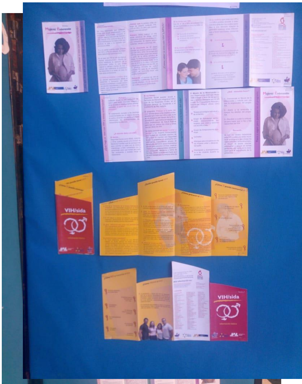
Periódico Mural Mujeres Embarazadas y Que es el VIH- SIDA