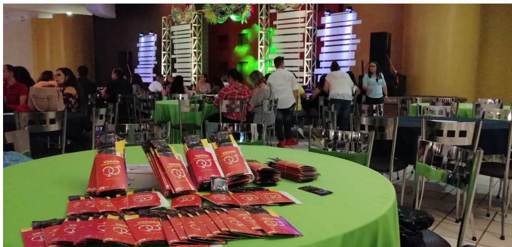
Entrega de material preventivo e informativo sobre las ITS, VIH – SIDA Entrega de material

Dentro de las actividades realizadas se instaló una mesa de información donde se brindó orientación personalizada, además a quienes lo solicitaron se obsequió material preventivo e informativo en materia de ITS, VIH – SIDA, en las instalaciones del Club de Leones dentro del evento Miss Gay San Juan de los Lagos, a dicho evento se acudió por invitación recibida, nos coordinamos con el IMAJ, Instituto Municipal de Atención a la Juventud.