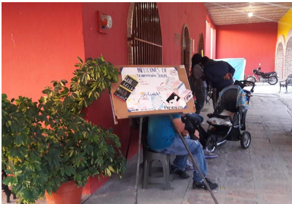
Delegación Municipal Mezquitic de la Magdalena periódico mural

En el corredor de la Delegación de Mezquitic de la Magdalena se instaló el periódico mural haciendo referencia a las ITS, VIH-SIDA, para el público en general, pero, haciendo énfasis en las mujeres embarazadas e invitando a realizarse la prueba gratuita de detección rápida, para prevenir infecciones de transmisión sexual.