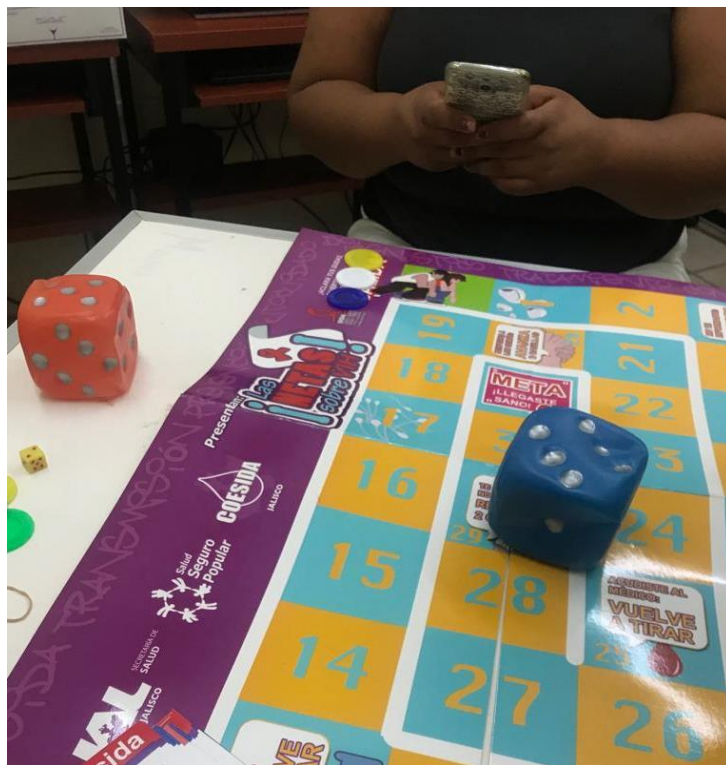
LAS NETAS SOBRE VIH- SIDA JUEGO DIDÁCTICO.