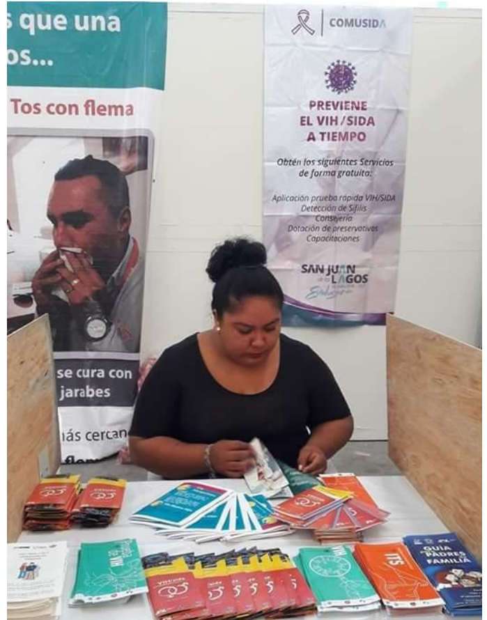
Módulo de Información instalado en Feria de la Salud

Durante la Feria de Salud en el lapso de una semana se proporcionó asesoría, información impresa con diferentes temas de prevención de VIH- SIDA, ITS, pláticas y material preventivo, en ésta feria nos coordinamos con la SSJ, quienes estuvieron aplicando las pruebas rápidas de detección de vih- sida y contamos con el apoyo del IMAJ, para la atención en el módulo instalado.