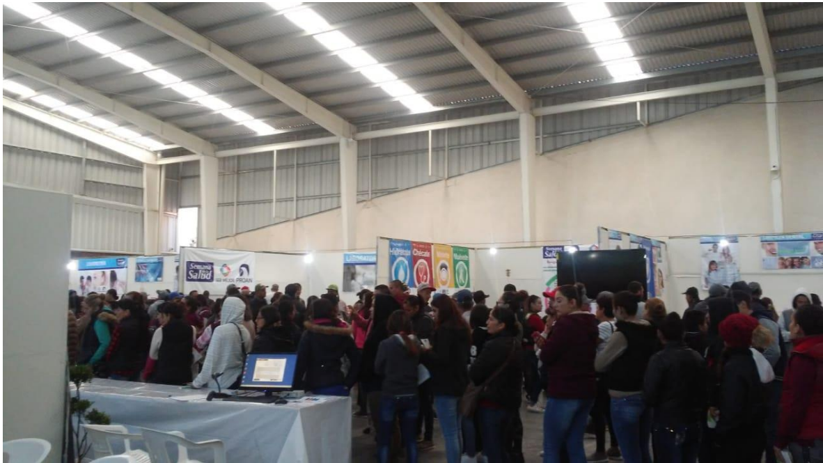
ASISTENTES A LA FERIA DE SALUD