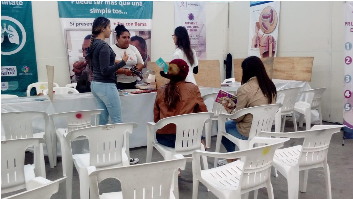
APLICACIÓN DE PRUEBAS DE VIH- SIDA, SÍFILIS GRATUITAS