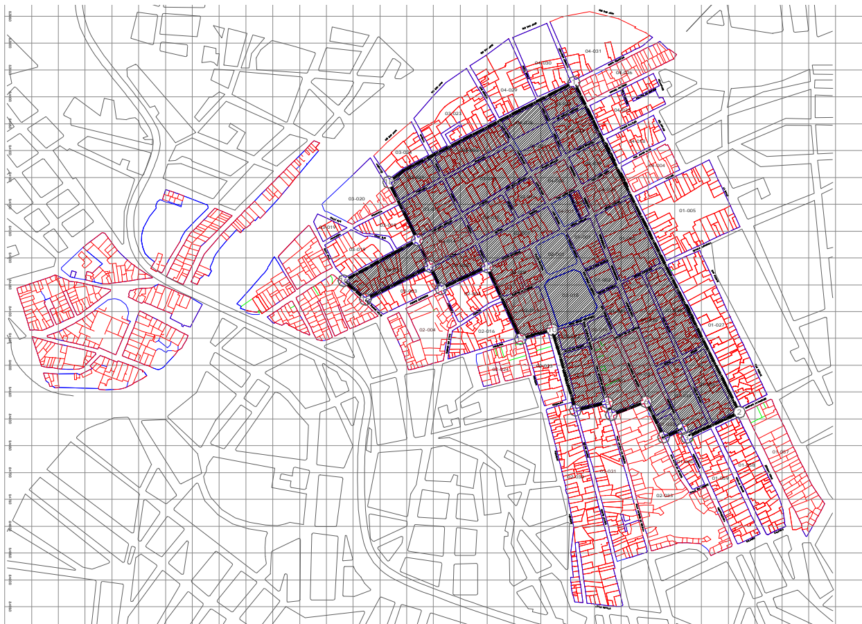
Gráfica G- 3 Señala la delimitación del área de estudio en su parte central y la ubicación de monumentos aislados que requieren de protección fuera del área de estudio