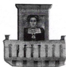
Casa de la Cultura "María Izquierdo"