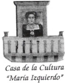
Casa de la Cultura "María Izquierdo"