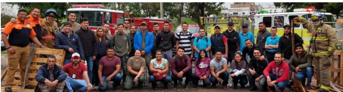
Incendio de vertedero municipal

Por medio de la presente me dirijo a usted esperando que goce de excelente salud de la misma forma se le anexa lo requerido y los servicios realizados en el transcurso de julio a septiembre de servicio en el año en curso.