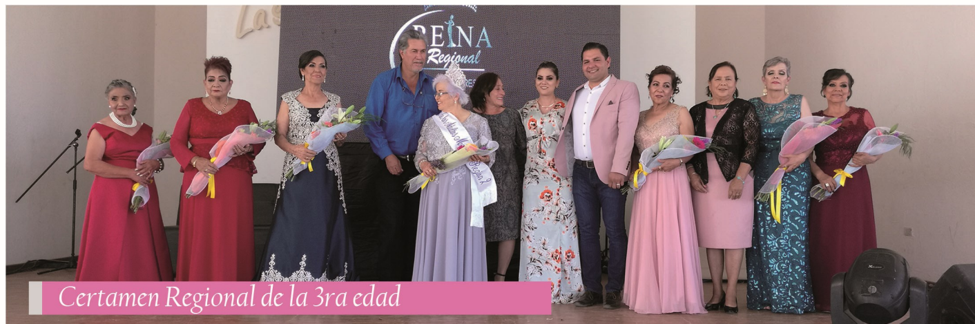
Certamen Regional de la 3ra edad