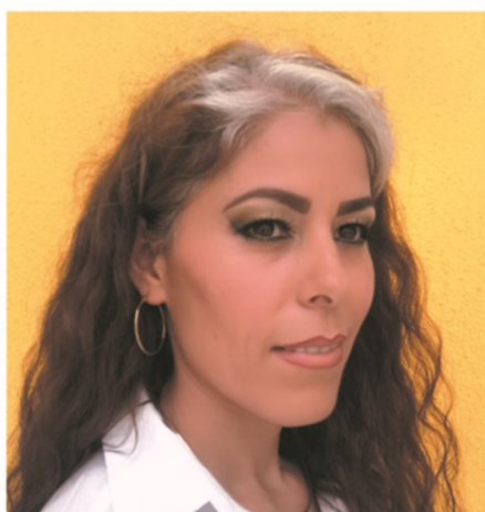
Cursos de maquillaje y automaquillaje