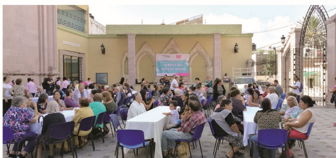
Convivencia con grupos de la 3ra edad y residentes de la Casa Hogar "San José"