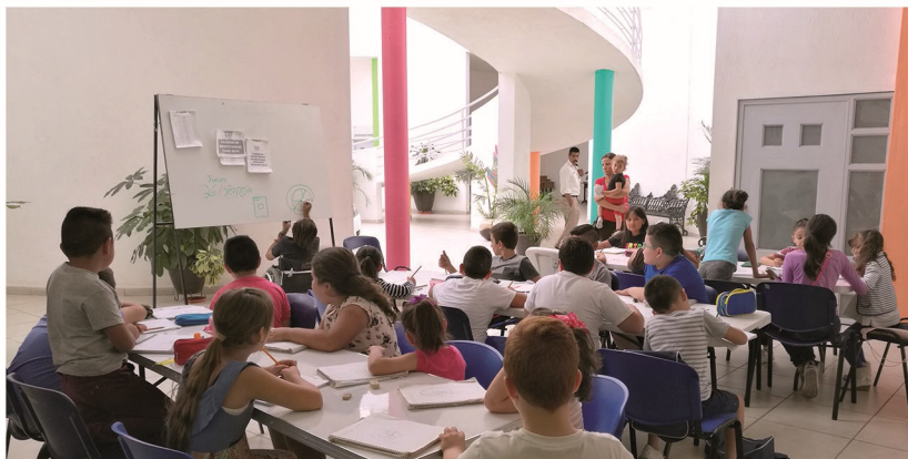
Clases de dibujo