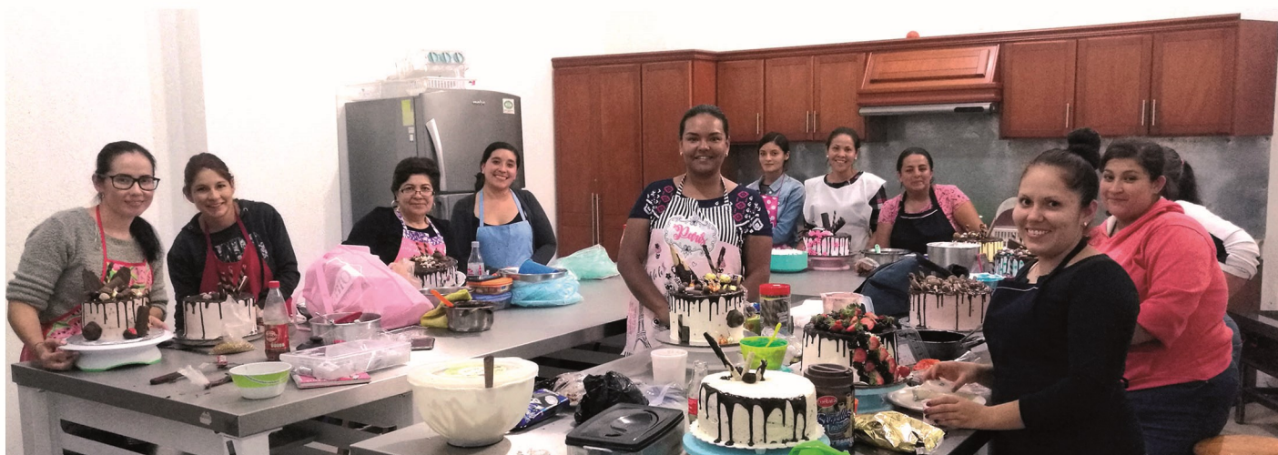
Elaboración y decoración de pastelería fina