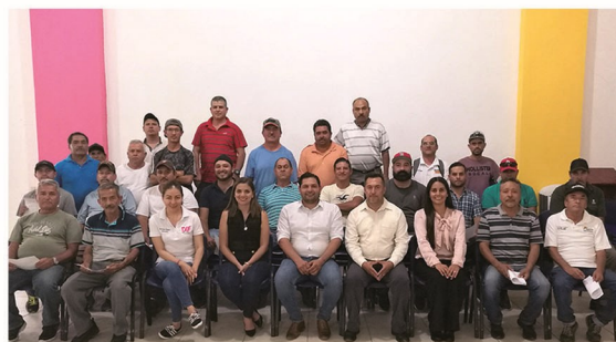
Talleres para taxistas