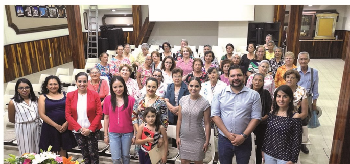
Ciclo de conferencias "La juventud se lleva en el alma"