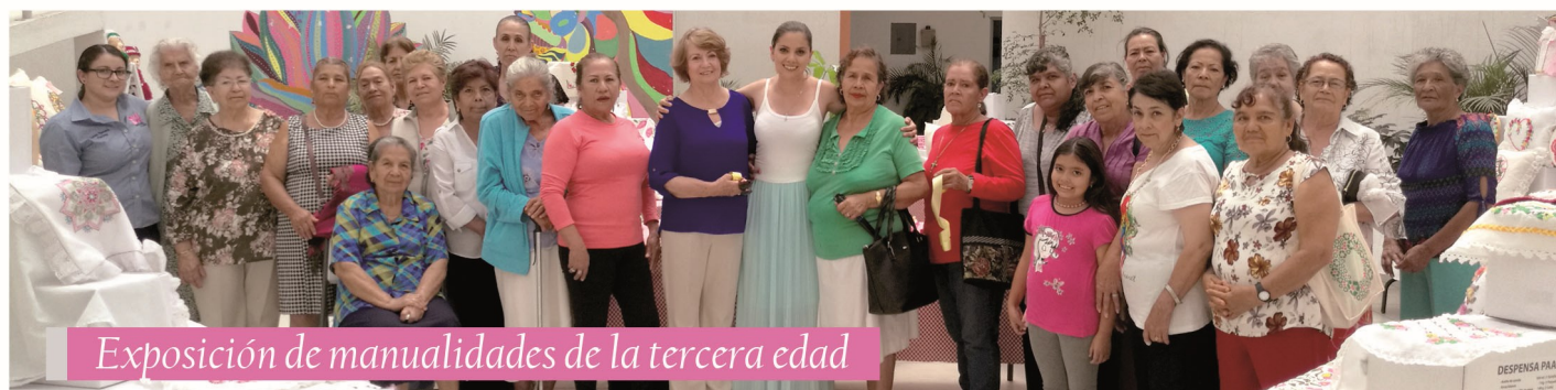
Exposición de manualidades de la tercera edad