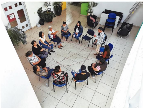
Encuentro entre generaciones (adultos mayores y jóvenes universitarios).