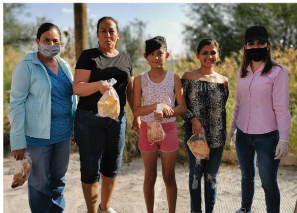
3,340 kg de pollo fresco donado por Bachoco a 2,600 familias sanjuanenses.