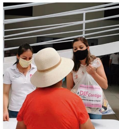
480 despensas con 480 dotaciones de huevo fresco a mismo número de familias