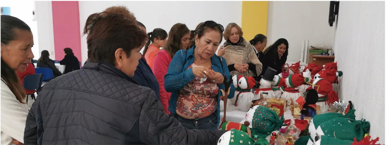
Elaboración de manualidades en cada grupo de convivencia.