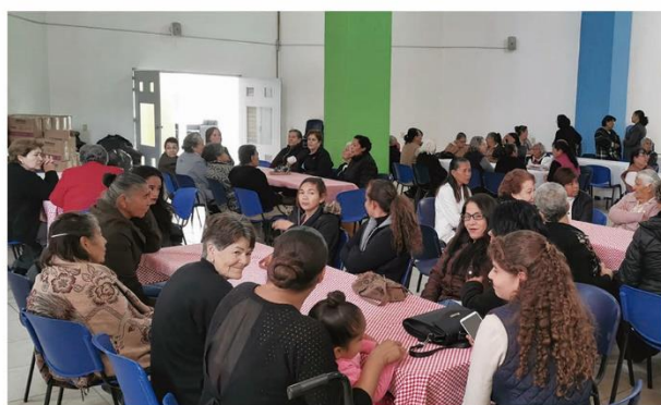
Posada navideña a los grupos de convivencia de la tercera edad