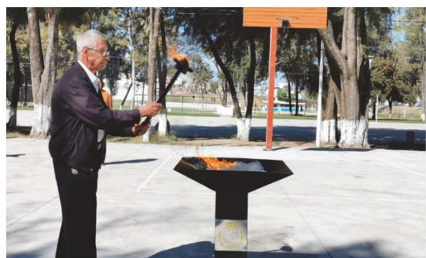
Sede de la Jornada regional deportiva y cultural del Adulto Mayor.