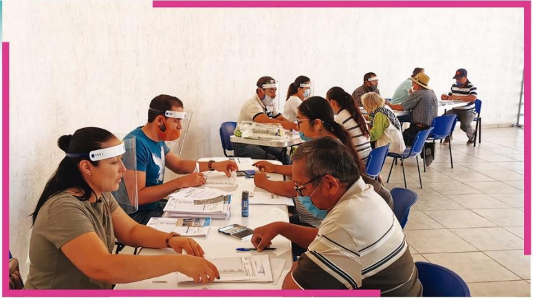
Recepción de documentos para la conclusión del programa de calentadores solares del Programa “Jalisco Revive tu Hogar”