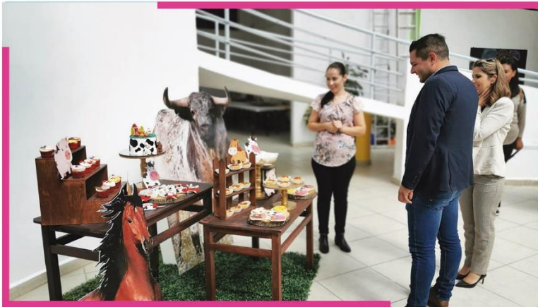
Clausura de talleres impartidos por el Instituto de Formación para el Trabajo del Estado de Jalisco.