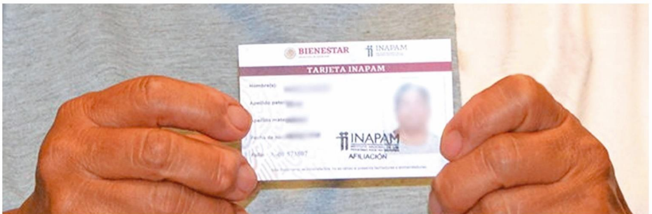
Tramitamos y entregamos 150 credenciales del INAPAM.