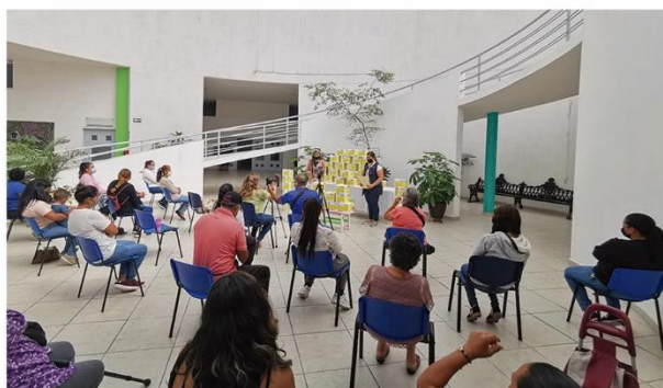
100 despensas donadas por Coppel a 100 familias vulnerables.