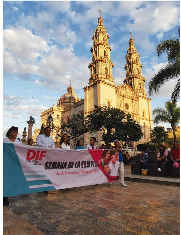
Caminata por la familia "Entender las emociones en la familia nos fortalece".