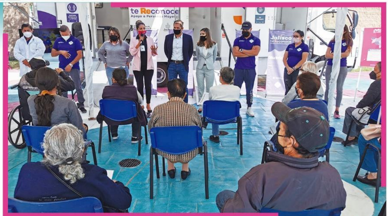
Atención médica móvil a los adultos mayores inscritos en el Programa “Jalisco te Reconoce”.