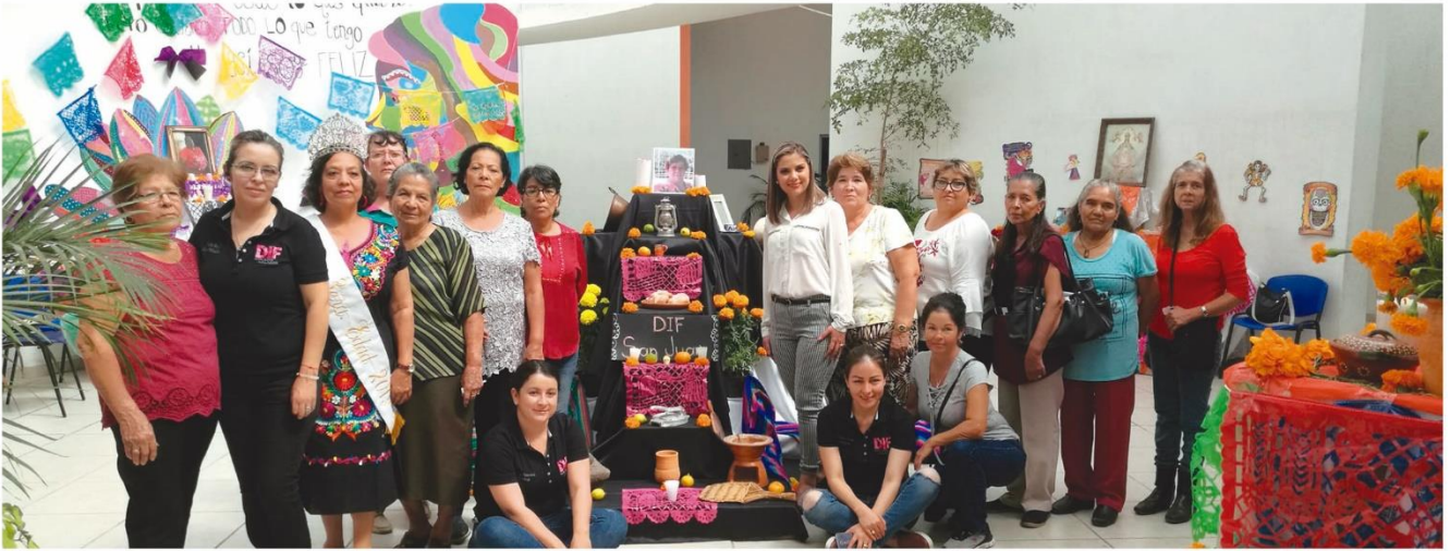
Exposición de altares de muertos.