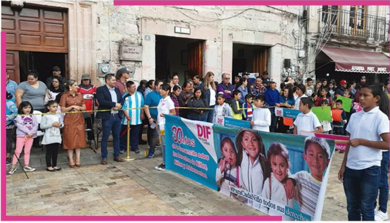
Commemoración del 30 Aniversario de Convención de los Derechos de los Niños, Niñas y Adolescentes.