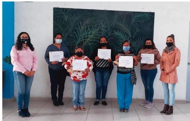
Ciclos de conferencias y entrega de constancias a padres y madres.