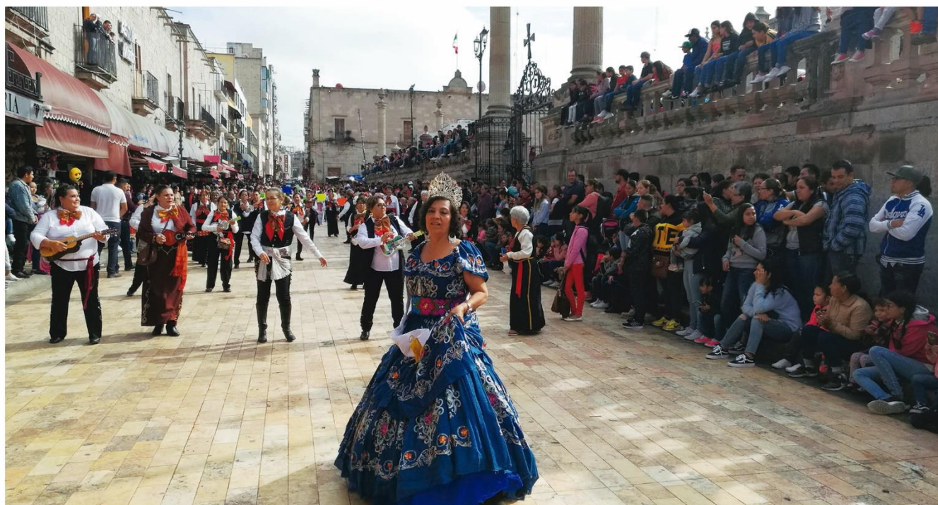
Participación en el desfile conmemorativo de la Revolución Mexicana 2019.