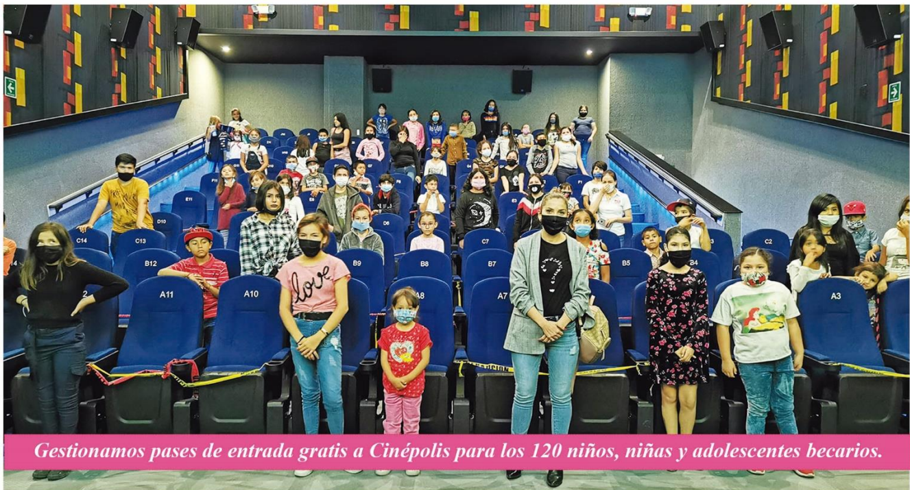
Gestionamos pases de entrada gratis a Cinépolis para los 120 niños, niñas y adolescentes becarios.